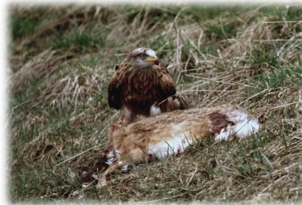
Rotmilan an Aas (R. Diemer)

Als Aasfresser und Kleintierjäger kontrolliert der Rotmilan im niedrigen Suchflug stundenlang die offene Landschaft mit kurzrasigen (beweideten) Flächen. Im Frühjahr besteht ein wesentlicher Anteil seiner Nahrung aus Regenwürmern, die zu Fuß erbeutet werden.